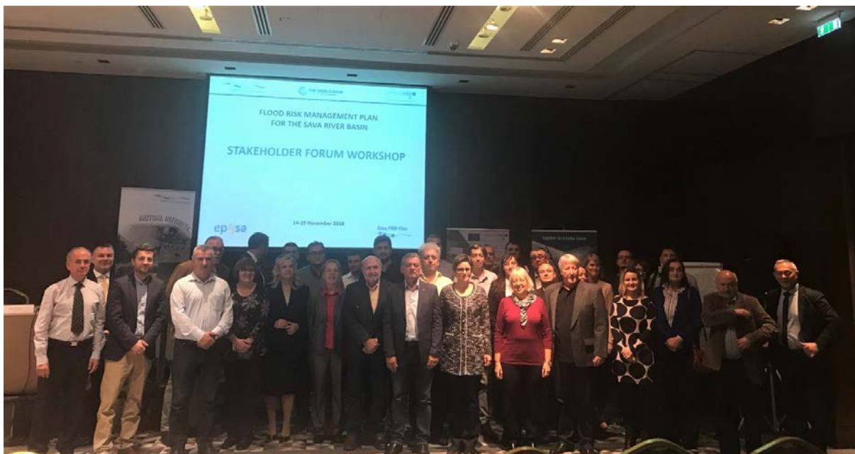
Sudionici foruma dionika – 1. dan