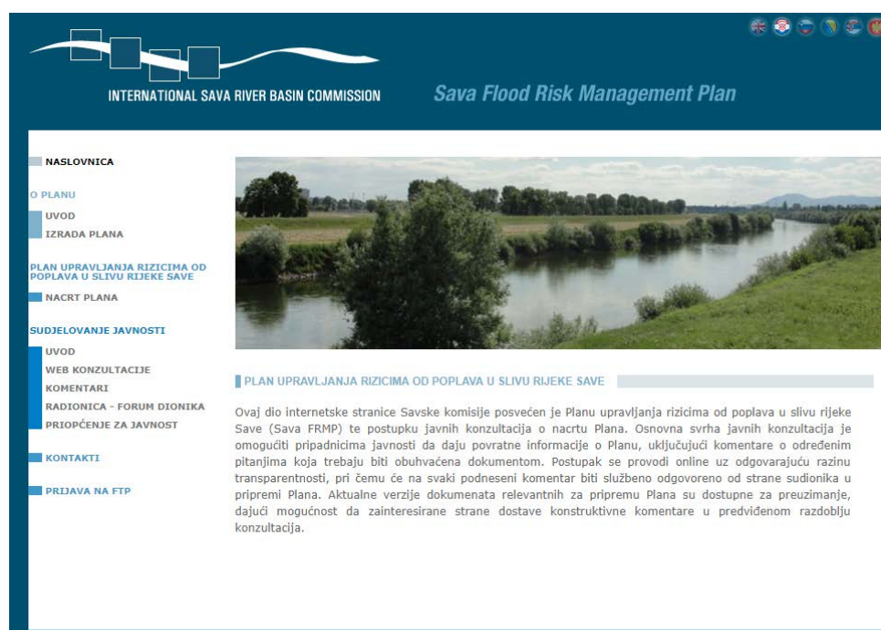
Slika 1: Službena internetska stranica Savske komisije

Informacije o razvoju Sava FRMP su javno dostupne na mikro web stranici službene internetske stranice Savske komisije - http://www.savacommission.org/sfrmp/hr/ (Slika 1).