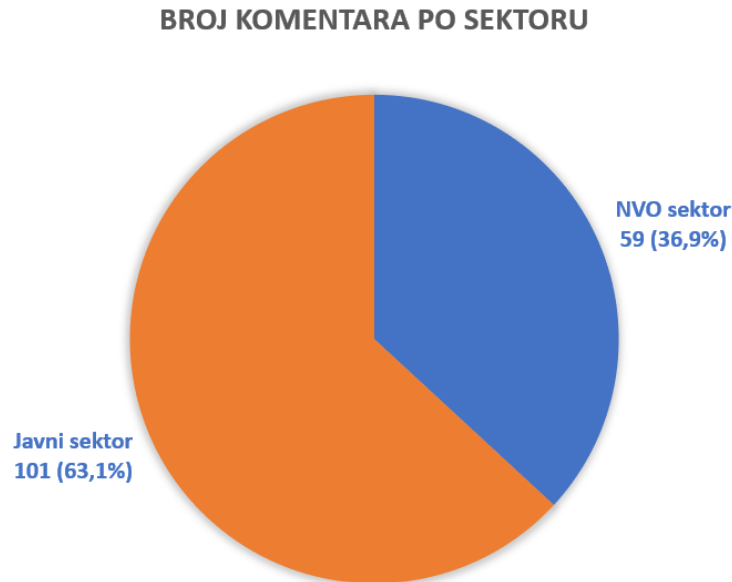
Slika 4: Broj komentara po sektoru

Raspodela po sektorima: primljen je 101 komentar iz institucija javnog sektora i 59 od nevladinog sektora (slika 4).