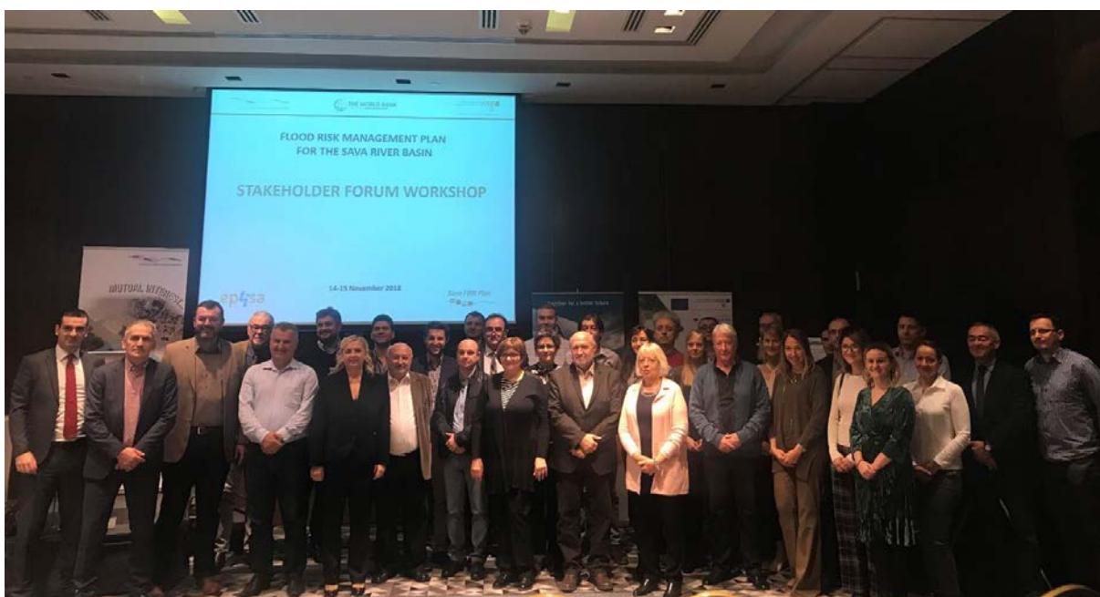
Sudionici foruma dionika – 2. dan