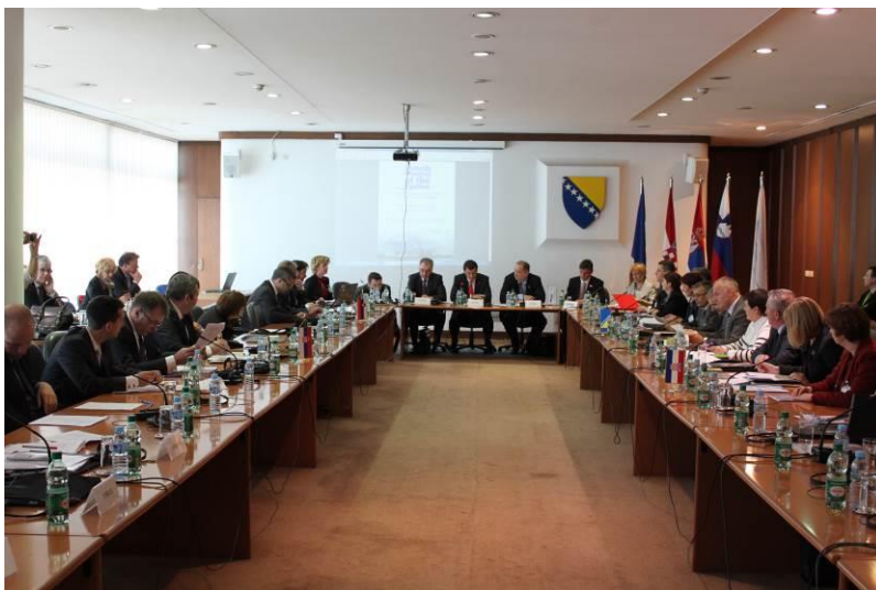
Slika 1. 4. sastanak država strana Okvirnog sporazuma (Sarajevo, 31. maj 2013.)

Tokom izvještajnog razdoblja uloženi su značajni naponi kako bi se ostvario dalji napredak u provođenju Okvirnog sporazuma i dodatno ojačali temelji za buduće provođenje Okvirnog sporazuma , što je osiguralo novu posvećenost država strana temeljnim aktivnostima Savske komisije. S tim u vezi je održan 4. sastanak država strana Okvirnog sporazuma (Slika 1) u finansijskoj 2013. godini (Sarajevo, 31. maj 2013.), te tri sjednice Savske komisije: 32. sjednica (Zagreb, 9. juli 2013.), 33. sjednica (Zagreb, 9-10. oktobar 2013.) i 34. sjednica (Podgorica, 18-19. februar 2014.) Osim toga, u tom razdoblju je održano 10 sastanaka stručnih grupa Savske komisije, kao i 34 konferencije, konsultacijske radionice i ostali sastanci sa interesnim grupama.