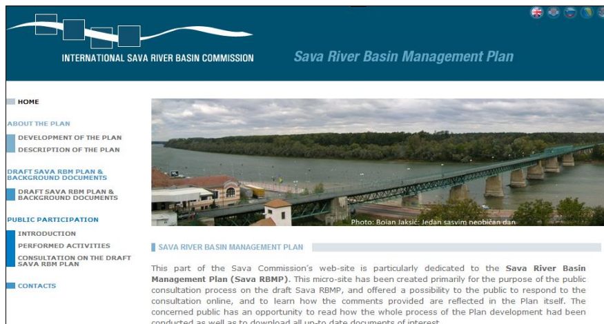
Slika 3. Mikro-web stranica Savske komisije posvećena Planu upravljanja slivom rijeke Save

Plan upravljanja slivom rijeke Save , pripremljen u skladu s Okvirnom direktivom o vodama EU-a (EU WFD) , pod koordinacijskim okriljem Savske komisije, zasigurno predstavlja ključnu prekretnicu u saradnji s državama stranama. Višegodišnji proces pripreme Plana završio je u septembru 2012., kad je nacrt Plana upravljanja slivom rijeke Save , sa svojih 13 dodataka, 22 karte i 10 popratnih dokumenata dostavljen na ocjenu Savskoj komisiji. Na temelju dogovora o modifikacijama nacrta Plana (verzija septembar 2012.) s 31. sjednice Savske komisije, revidirani Plan upravljanja slivom rijeke Save na svim jezicima dostavljen je Savskoj komisiji u aprilu 2013., na nastavak nacionalnih procedura koje prethode službenom usvajanju. Sa svom popratnom dokumentacijom, uključujući dokument javne rasprave, Plan je dostupan na mikro-web stranici Savske komisije, izrađenoj posebno za potrebe njegova razvoja (Slika 3). Osim toga, potpuna GIS baza podataka korištena u pripremi Plana , zajedno s kartama, poslata je relevantnim institucijama država strana u februaru 2014.