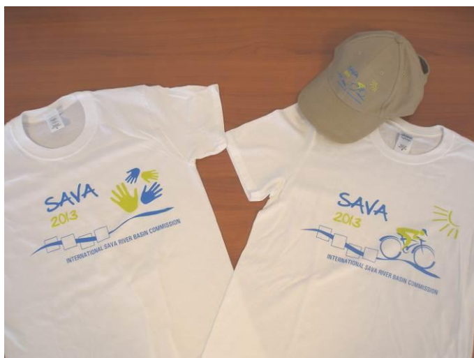
Slika 7. Promotivni artikli Savske komisije

U sklopu proslave distribuiran je cijeli niz promotivnih publikacija i širok spektar promotivnih artikala Savske komisije (Slika 7).