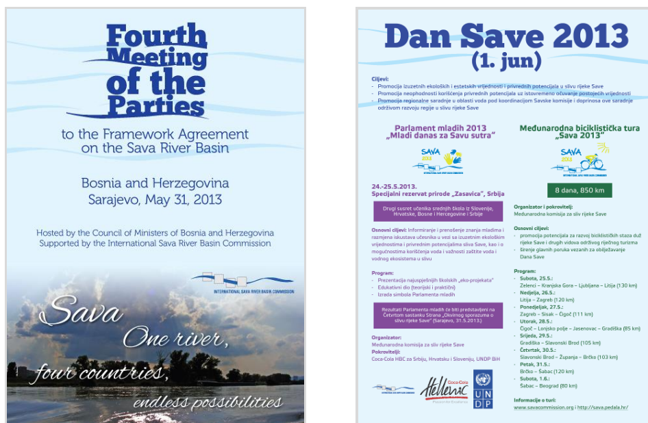
Slika 5. Plakati koji najavljuju 4. sastanak država stranaka i ostale događaje u organizaciji Savske komisije u sklopu proslave Dana rijeke Save 2013. g.