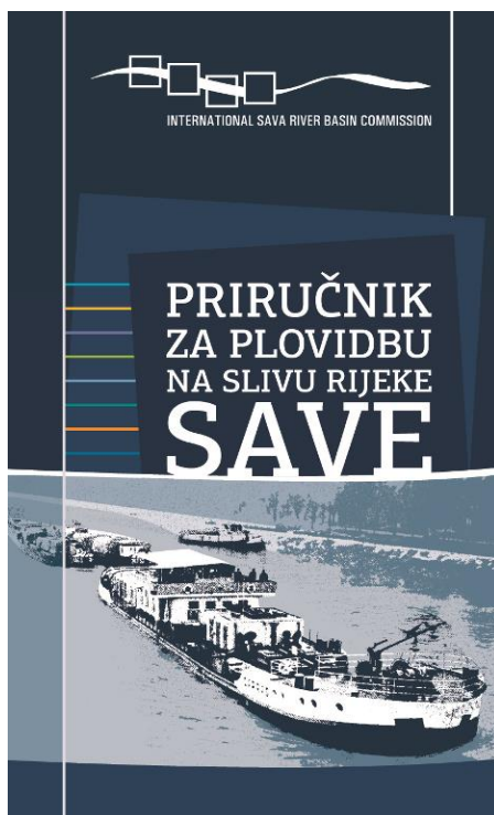
Slika 2. Priručnik za plovidbu na rijeci Savi (2014)