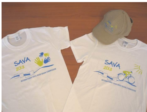
Слика 7. Промотивни артикли Савске комисије

У склопу прославе дистрибуисан је цијели низ промотивних публикација и широк спектар промотивних артикала Савске комисије (Слика 7).