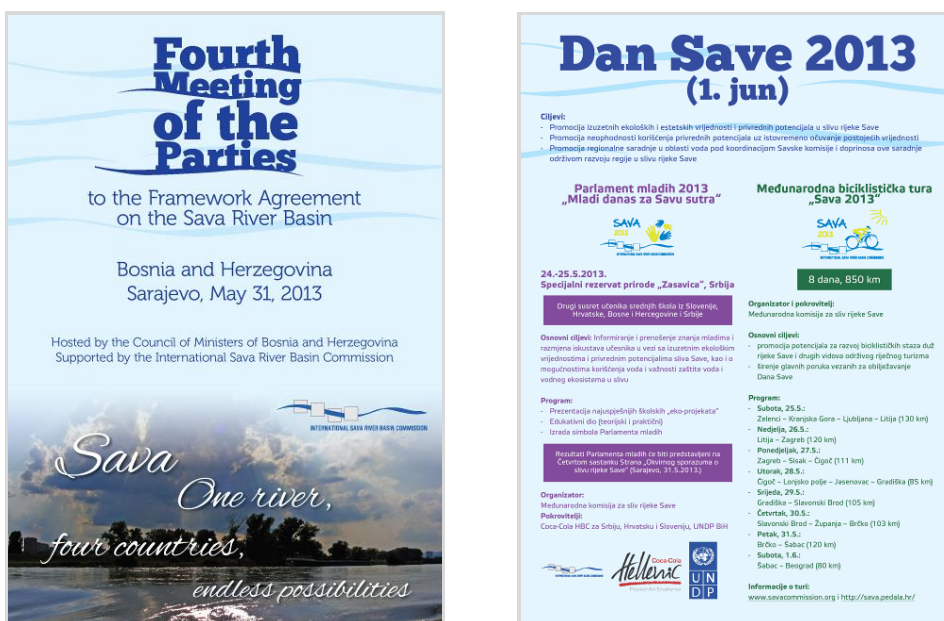
Слика 5. Плакати који најављују 4. састанак држава страна и остале догађаје у организацији Савске комисије у склопу прославе Дана ријеке Саве 2013. г.