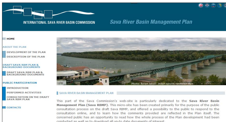
Слика 3. Микро-интернет страница Савске комисије посвећена Плану управљања сливом ријеке Саве

План управљања сливом ријеке Саве , припремљен у складу са Оквирном директивом о водама ЕУ-а (EU WFD), под координацијским окриљем Савске комисије, сигурно представља кључну прекретницу у сарадњи са државама странама. Вишегодишњи процес припреме Плана завршио је у септембру 2012., када је нацрт Плана управљања сливом ријеке Саве , са својих 13 додатака, 22 карте и 10 пратећих докумената достављен на оцјену Савској комисији. На основу договора о модификацијама нацрта Плана (верзија септембар 2012.) са 31. сједнице Савске комисије, ревидирани План управљања сливом ријеке Саве на свим језицима достављен је Савској комисији у априлу 2013., на наставак националних процедура које претходе службеном усвајању. Са свом пратећом документацијом, укључујући документ јавне расправе, План је доступан на микро-интернет страници Савске комисије, израђеној посебно за потребе његовог развоја (Слика 3). Осим тога, потпуна ГИС база података коришћена у припреми Плана , заједно са картама, послана је релевантним институцијама држава страна у фебруару 2014.