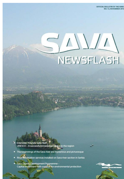
Слика 4. Савски вјесник бр. 11 (мај 2013.) и бр. 12 (новембар 2013.)

Остале активности у финансијској години 2013. укључивале су: