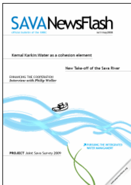
Slika 2. Uradni bilten Savske komisije, ki je bil izdan maja 2008.

Večina dejavnosti je bila realizirana ob določeni podpori podjetja “Coca Cola Beverages Company” iz Republike Hrvaške in Republike Srbije, ter ob podpori MIO-ECSDE.