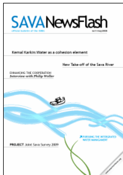
Слика 2. Службени билтен Савске комисије покренут у мају 2008.

Већина активности је реализована уз подршку компаније “Coca Cola Beverages” из Републике Хрватске и Републике Србије, као и МИО-ECSDE.